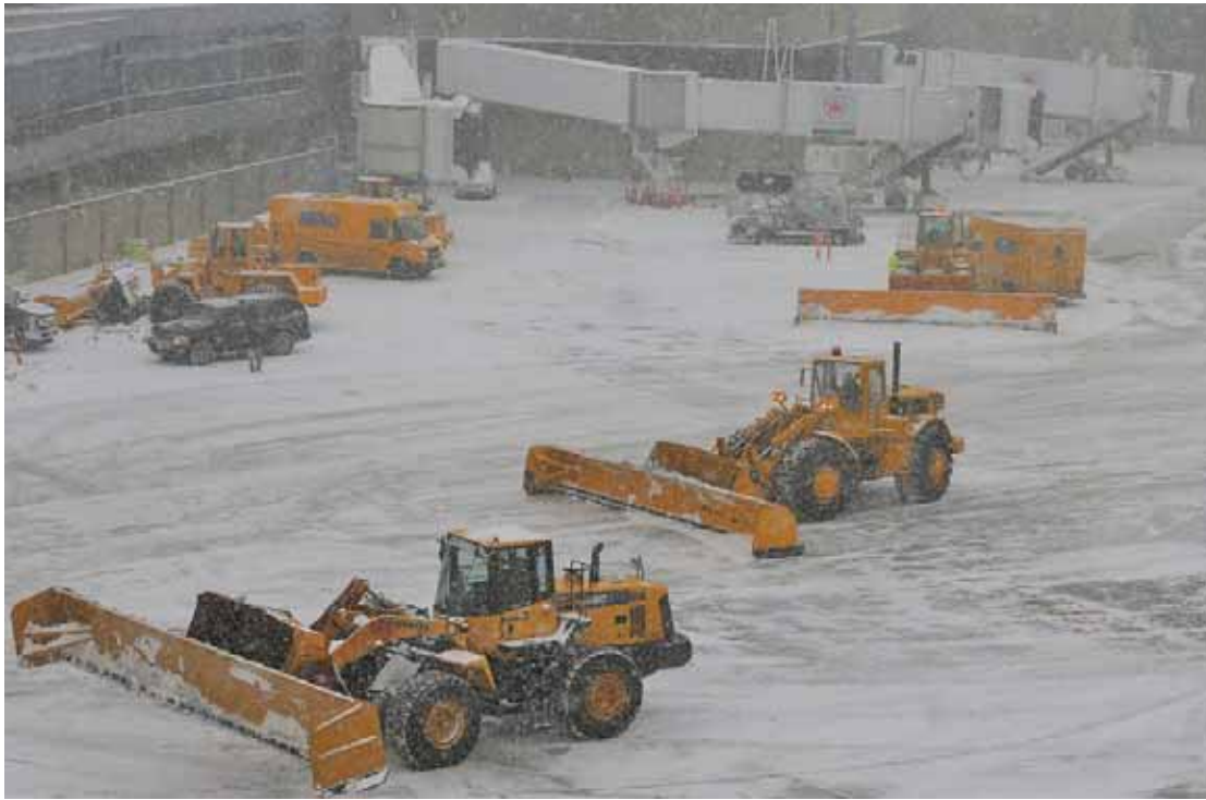
מען שארט די שניי ביים עירפארט אין באסטאן

פלוצלינג'דיגן ערשיינונג דערפון. מען האט געוואוסט אז עס קומט א גרויסע קעלט אויף ענדע וואך, אבער דער לופט דרוק איז זייער שנעל געפאלן העכער'ן דרום-מזרח ראיאן, האט דאס ערגער געמאכט דעם מצב ווען די ווינטן האבן דערגרייכט ביז 76 מייל פער שעה. (ביי 75, הייסט עס שוין א "האריקעין"). דאס האט אויך געברענגט די שווערע שנעלע שטארקע שנייען. אין געוויסע פלעצער איז געפאלן ביז פינף אינטשעס שניי א שעה.