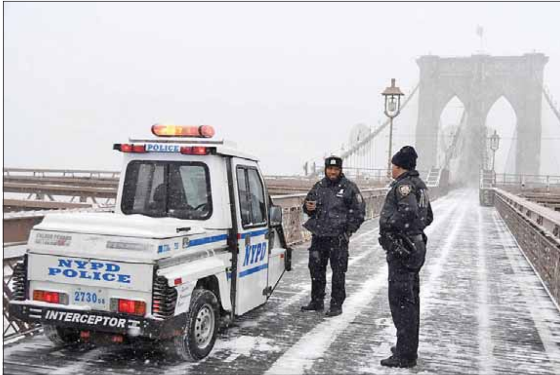
פאליציי ביים ברוקלין בריק, מען האט נישט געקענט זעהן די מאנהעטן זייט ווען די געדעכטע שניי איז געפאלן

די שטאט ניו יארק איז שווערער געטראפן געווארן פון דעם שניי שטורעם ווי מען האט ערווארט. דינסטאג אווענט האבן נאך די וועטער באריכטן געשאצט אז די שטאט קען אפקומען מיט בלויז 1 ביז 3 אינטשעס שניי, מיטוואך האט מען שוין גערעדט פון 4 ביז 6 אינטשעס, און דאנערשטאג האט מען געזען אז עס איז געווען פיל ערגער, איבערהויפט צוליב די שטארקע ווינטן.