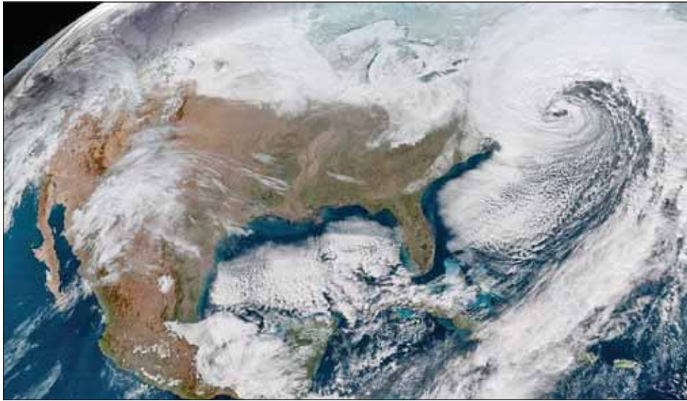
סאטעליט בילד וואס ווייזט דעם בליזארד ווי עס בושעוועט נעבן מזרח ברעג פון אמעריקע

גרעסערער שניי שטורעם ווי געראכטן אין ניו יארק