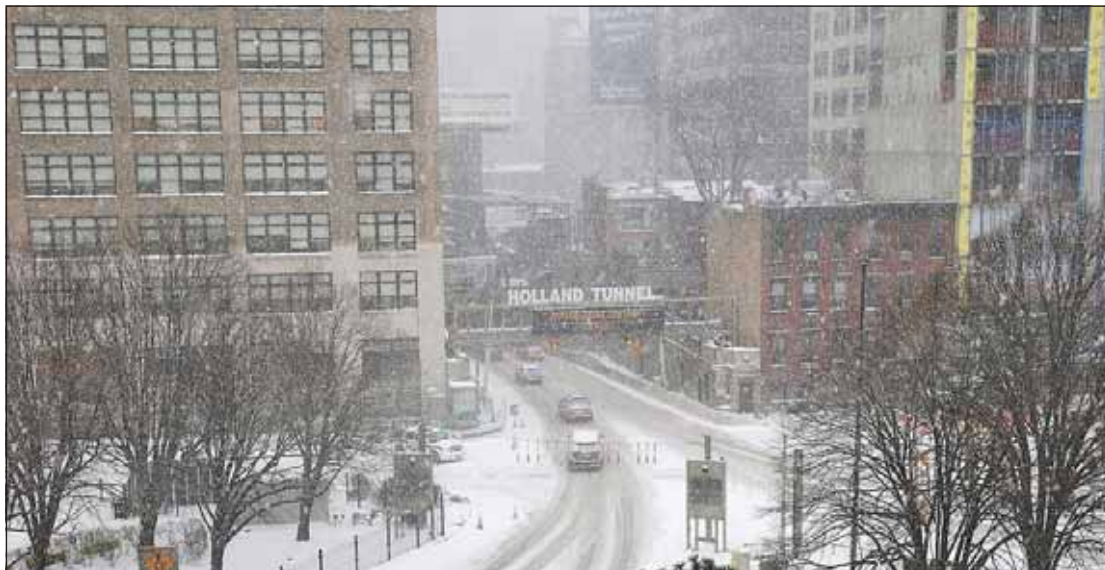
ביים אריינגאנג צום האלאנד טונעל איז געשטאנען א ווארענונג "נישט פארן אויב עס איז נישט וויכטיג"

די פעריס האבן אויפגעהערט צו פארן 12:00 מיטאג אבער די סאבוועיס וועלן ווייטער פארן, כאטש מיט