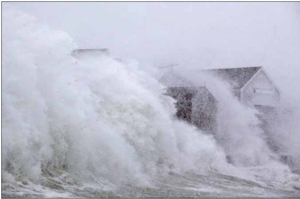
שניי בליזארד פארדעקט א הויז אין סקיטועט, מאסאטשוסעט

דאנערשטאג האט מען שוין געהאט א חשבון פון איבער 4,000 עראפלאן רייזעס וואס זענען אפגערופן געווארן אין די צפון מזרח סטעיטס, און פולע הונדערטער רייזעס וואס וועלן נישט קענען קענעדי און לאגוארדיע עירפארטס פולשטענדיג געווען געשלאסן און אין נוארק איז אויך געווען א סאך א קלענערע צאל רייזעס. (ווי מער אויף מערב, אוועק פון אטלאנטיק, אלץ שוואכער איז געווען דער שטורעם.) מען האט באצייכנט דעם שטורעם ווי א "באמבע סייקלאון", צוליב דעם גרויסן קראפט און